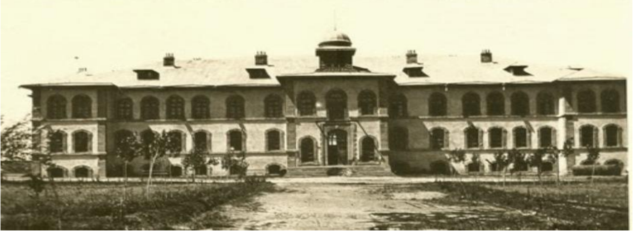
ERZURUM KONGRESİ (Toplantısı)

Mustafa Kemal Atatürk'ün, Samsun'dan Amasya'ya, Erzurum'a, Sivas'a, oradan da Ankara'ya geçip Meclisi açması, o günün şartlarında gerçekleştirilmesi zor bir olaydır.